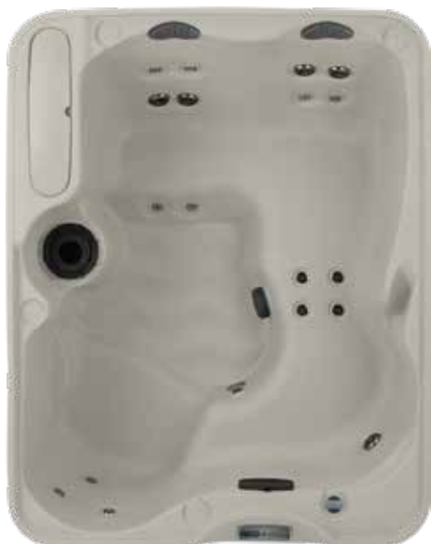
Azure en Sable