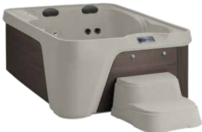
Azure en Sable / Marron avec seau à glace intégré